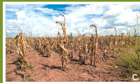
Dürren und Stürme