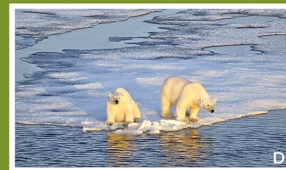
Abschmelzen der Pole